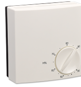
LTM TL HUMIDITY