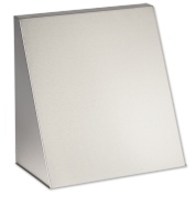
LTM dezent BA VA 410 B