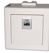
LTM dezent APD BT